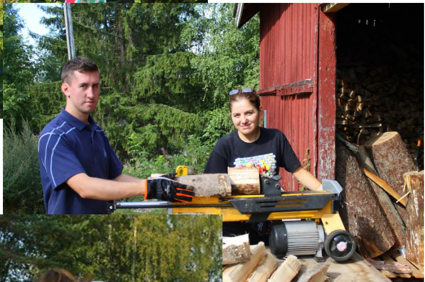
..polttopuiden pätkimistä ja halkomista ...