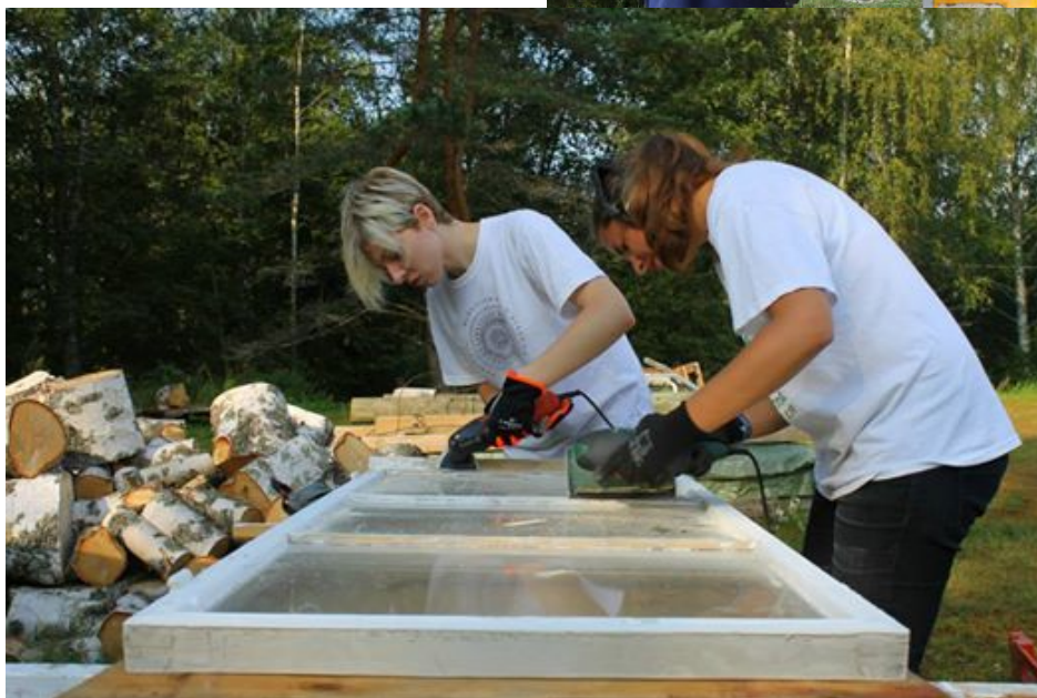
... ikkunanpuitteiden kunnostusta... Lisäksi mm. Halkoniemi sai hyppylaiturin ja koulun ulkorakennus siistittiin