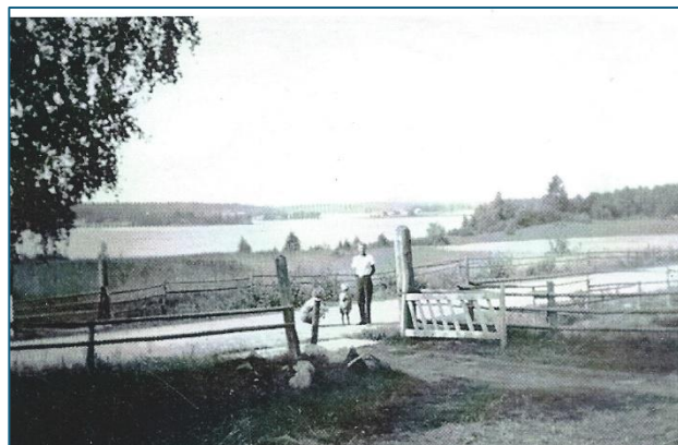
Kuoreveden tietä viime vuosisadan alkupuolelta Viitalan kohdalla

Suinulan tie on vuosien varrella muuttunut monin tavoin, ja samalla sen varrella elänyt kylä on kokenut omat vaiheensa. Tero Ala-Ajos